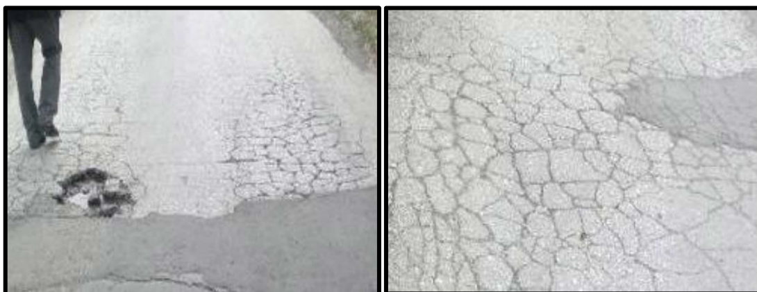
Oštećenja kolovoza „paukova mreža“

Oštećenja, uočena snimanjem na terenu, su tipična za neprimjerno saobraćajno opterećenje ceste male nosivosti. Kolovoz je na cijeloj trasi, na puno mjesta u velikoj površini, negdje i cijelom širinom, karakteristično ispucao, u obliku „paukove mreže“.