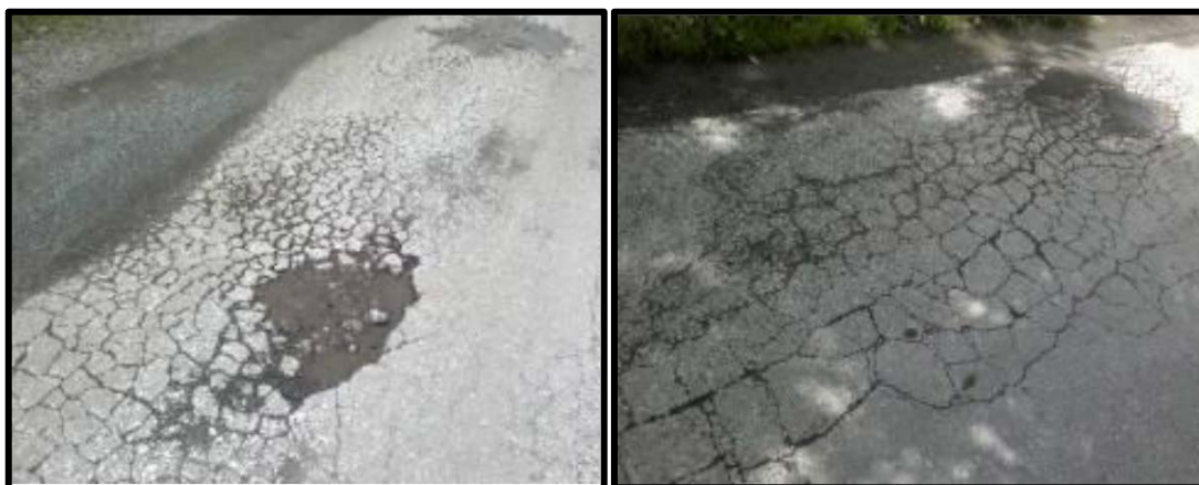
Oštećenja kolovoza izražena na ivicama ceste na kolotragu teških teretnih vozila